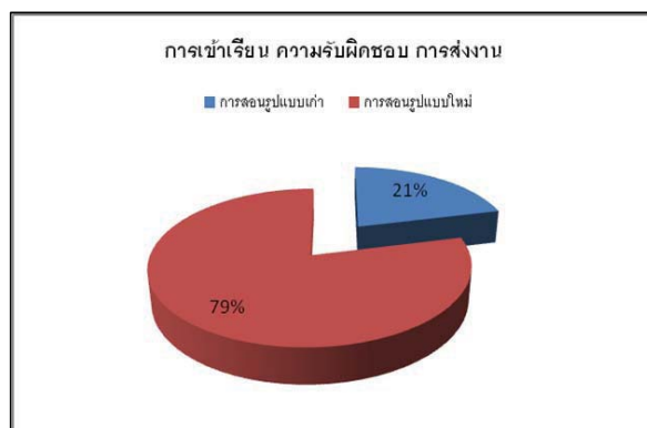
ภาพที่ 1 แสดงค่าพฤติกรรมกรการเข้าชั้นเรียน ความรับผิดชอบ และการส่งงานของกลุ่มนักศึกษาทั้งสองกลุ่ม

การติดตามและสังเกตพฤติกรรมหลังจากปรับเปลี่ยนวิธีการสอน โดยสังเกตจากการเข้าชั้นเรียน ความรับผิดชอบในงานที่ได้รับมอบหมาย ทั้งงานเป็นรายกลุ่ม และงานเฉพาะบุคคล เปรียบเทียบกับผู้เรียน 2 กลุ่ม ระหว่างวิธีการสอนเดิม (โดยทำการเก็บข้อมูลจากนักศึกษา ระดับ วท.บ. ชั้นปีที่ 4 ที่ลงทะเบียนเรียนรายวิชาการจัดการปศุสัตว์ ในภาคการศึกษาที่ 1 ปีการศึกษา 2553) และรูปแบบการสอนใหม่ (โดยทำการเก็บข้อมูลจากนักศึกษา ระดับ วท.บ. ชั้นปีที่ 4 ที่ลงทะเบียนเรียนในรายวิชาการจัดการปศุสัตว์ ในภาคการศึกษาที่ 1 ปีการศึกษา 2554) พบว่า พฤติกรรมการเข้าชั้นเรียน ความรับผิดชอบ และการส่งงานของกลุ่มนักศึกษาที่ได้รับรูปแบบการสอนใหม่ มีความรับผิดชอบในงานที่ได้รับมอบหมาย ทั้งงานรายกลุ่มและงานบุคคล มีค่าเท่ากับ 78.82 สูงกว่าค่าพฤติกรรมกรการเข้าชั้นเรียน ความรับผิดชอบ และการส่งงานของกลุ่มนักศึกษาที่ทำการเรียนการสอน โดยวิธีการสอนเดิม มีค่าเท่ากับ 21.18 อย่างมีนัยสำคัญ ที่ระดับนัยสำคัญ 0.05 ดังแสดงในกราฟ